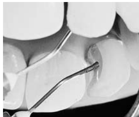
写真2：ブルーマイクロチップでのⅢ級窩洞への塗布