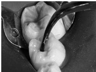
写真1：インスパイラルブラシチップでの裂溝への塗布